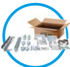
Caja de herrajes con tornillería