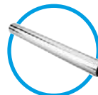
Tubo de torsión