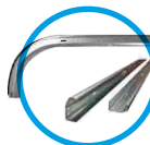
Guías verticales y horizontales